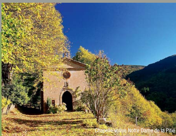
Chapelle votive Notre Dame de la Pitié

A voir également : les Sept cloches, la Croix biface, le lavoir, la Chapelle votive Notre Dame de la Pitié, les Lamas de Castans. Office de Tourisme : 04 68 76 34 74