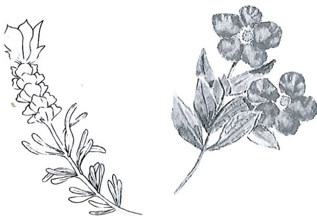
Cistes (ci-dessus) et lavandes (ci-contre) ( Cistus albidus et Lavandula angustifolia )

La nature lui a donné des pattes aux ongles très longs ce qui ne lui permet pas de se poser sur les branches. Son chant et sa façon de voler la font reconnaître aisément.